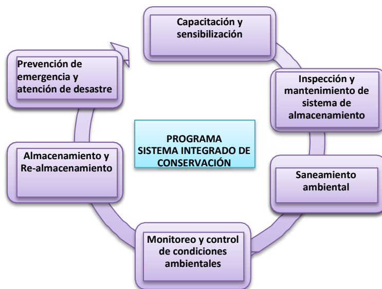
Ilustración No. 1 Programas de Conservación Preventiva para la Implementación del SIC