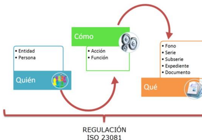
Ilustración No. 2 Metadatos ISO 23081

Es necesario disponer de una funcionalidad especialmente diseñada para el registro (manual o automático) de esquemas de metadatos dirigidos al almacenamiento de información útil para la preservación de documentos electrónicos de archivo, teniendo en cuenta las actividades de recepción, producción y trámite.